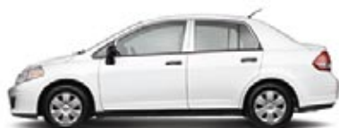
1.6 BÁSICO: SÓLO SEDÁN