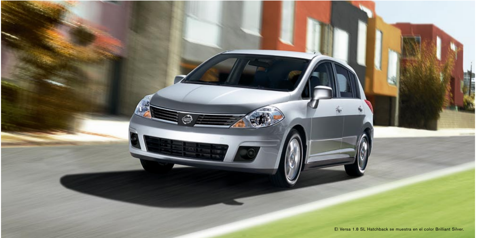
El Versa 1.8 SL Hatchback se muestra en el color Brilliant Silver.