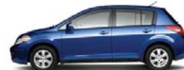
1.8 SL: HATCHBACK Y SEDÁN