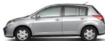
1.8 S: HATCHBACK Y SEDÁN