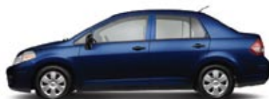
1.6: SÓLO SEDÁN