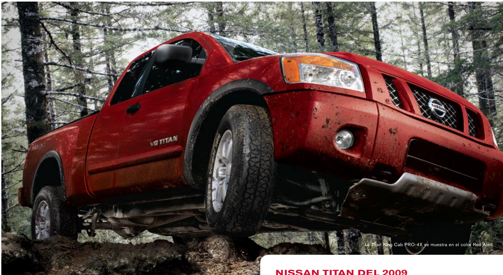
La Titan King Cab PRO-4X se muestra en el color Red Alert.