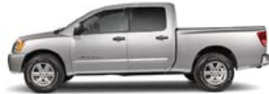
SE 4X2 Y 4X4