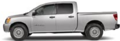
XE 4X2 Y 4X4