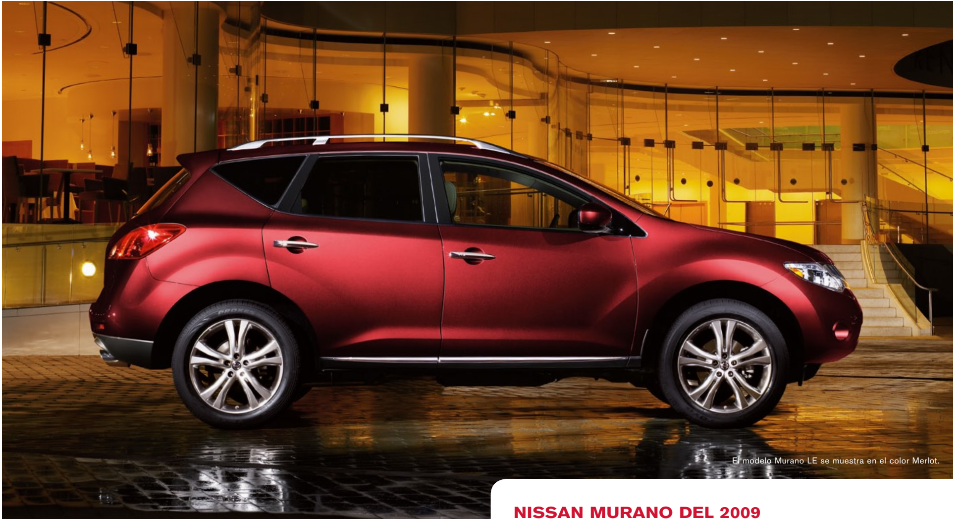
El modelo Murano LE se muestra en el color Merlot.