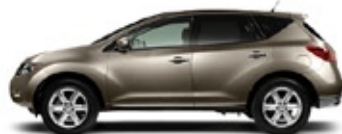
SL: UNA EXPRESIÓN DE BELLEZA