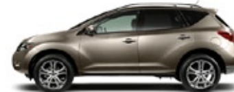
LE: UNA IMAGEN DE LUJO