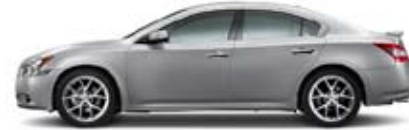
3.5 SV: CON EL PAQUETE DEPORTIVO