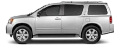
PLATINUM: LA EXPERIENCIA COMPLETA