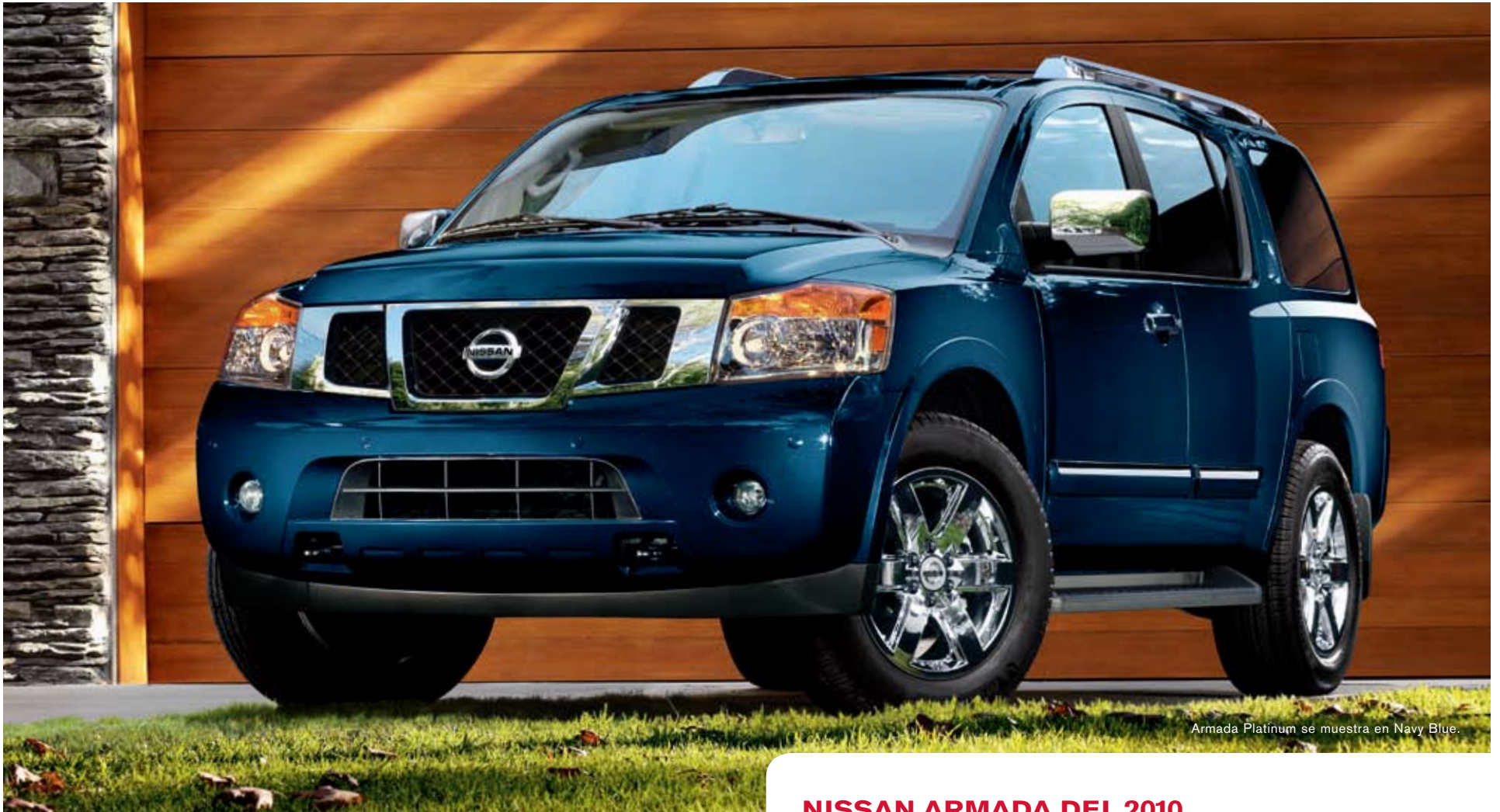
Armada Platinum se muestra en Navy Blue.