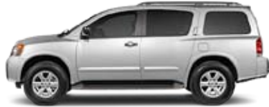
SE: QUE COMIENCE LA AVENTURA