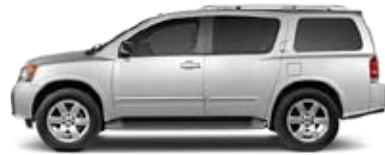
TITANIUM: LISTO PARA EN FRENTAR EL MUNDO