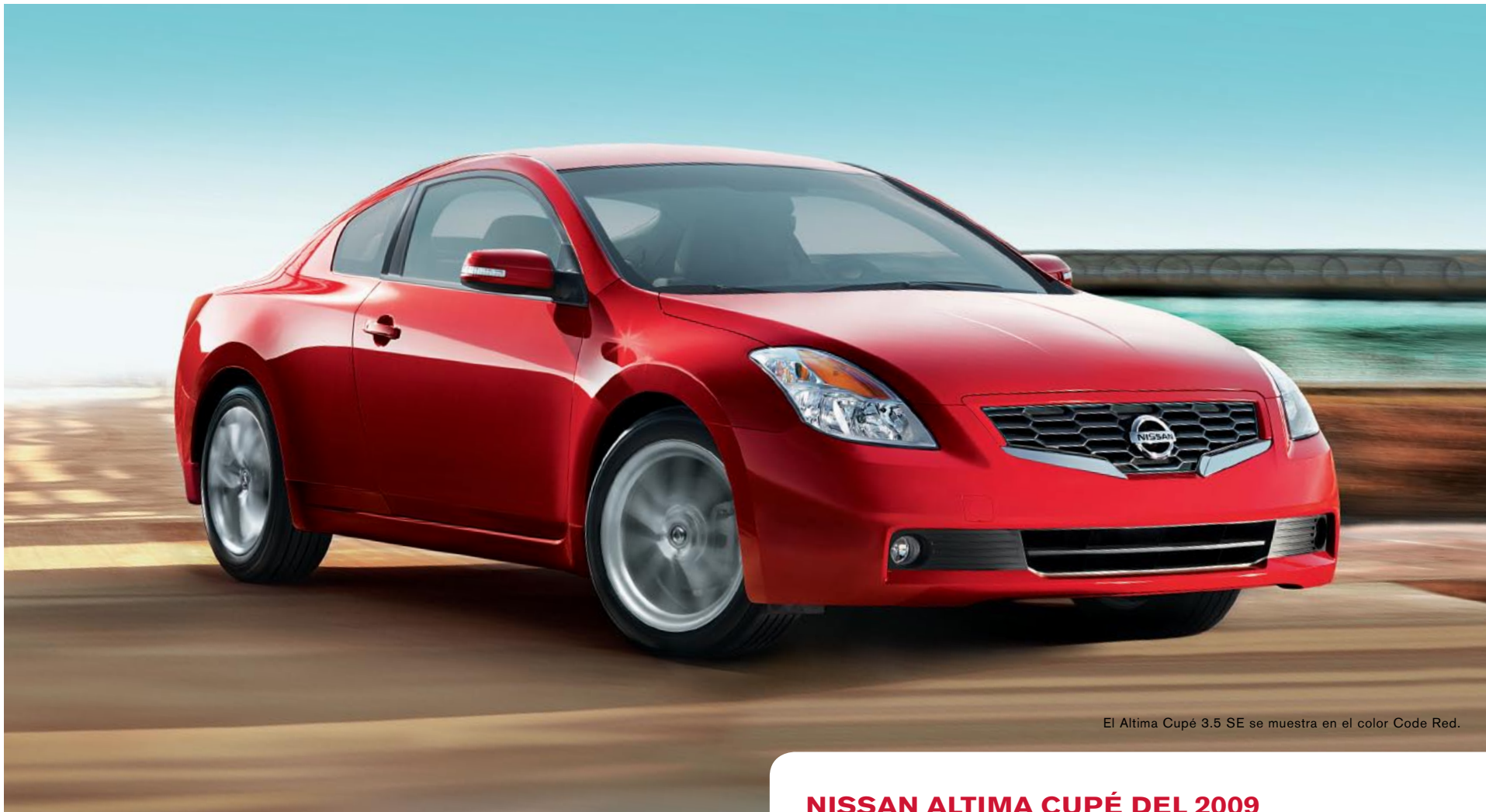
El Altima Cupé 3.5 SE se muestra en el color Code Red.